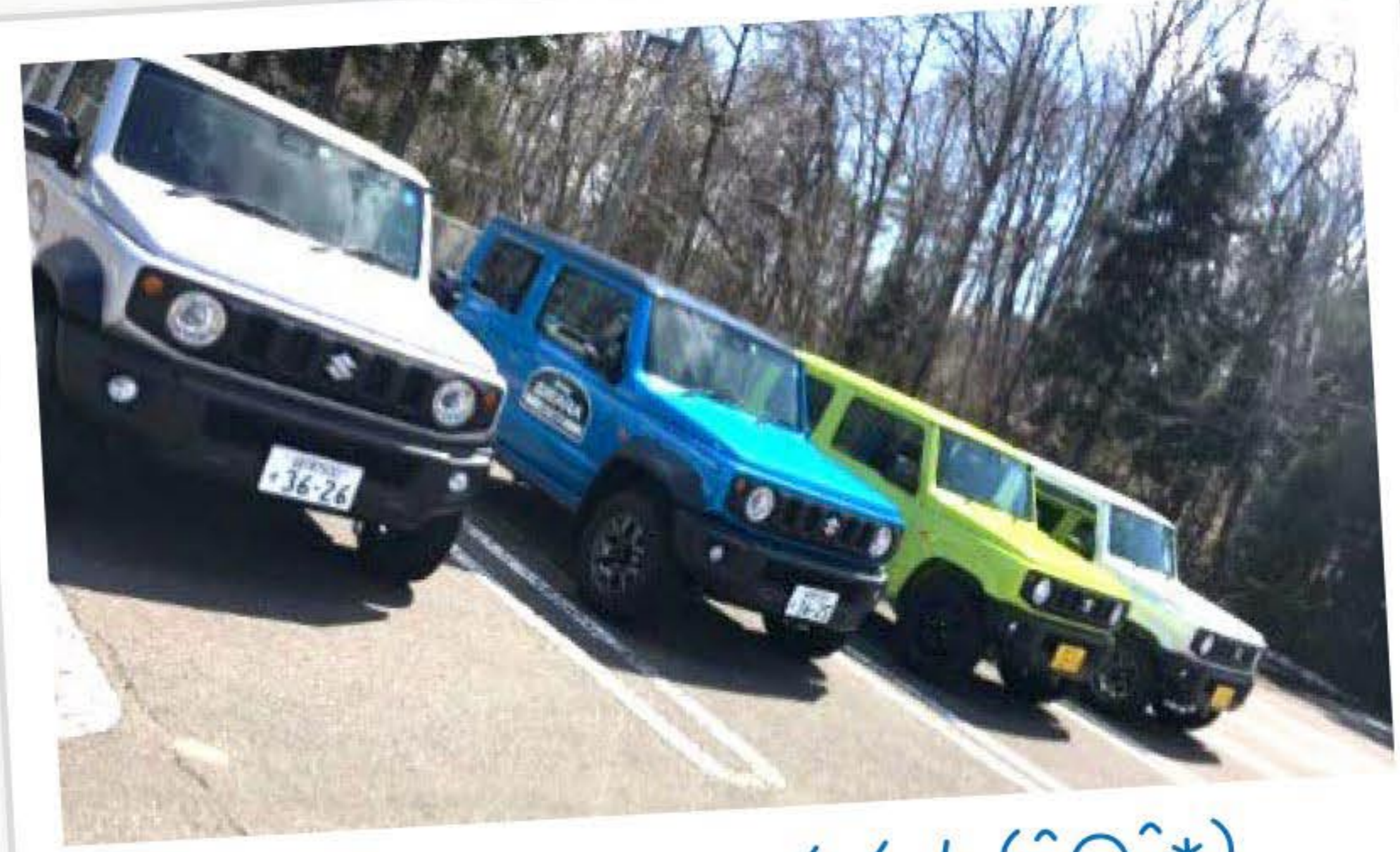
並べるとカッコイイ!(^o^*)