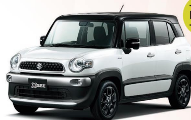
ラッシュイエローメタリック ホワイト2トーンルーフ（D8G）