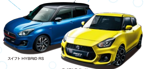
スイフト HYBRID RS