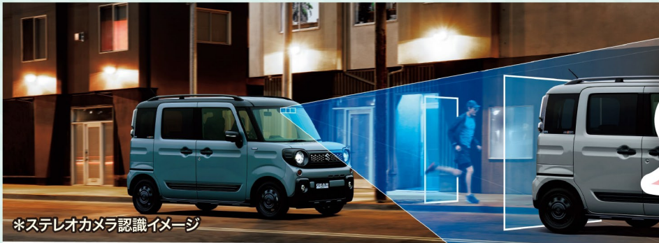
*ステレオカメラ認識イメージ