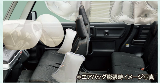
*エアバッグ膨張時イメージ写真