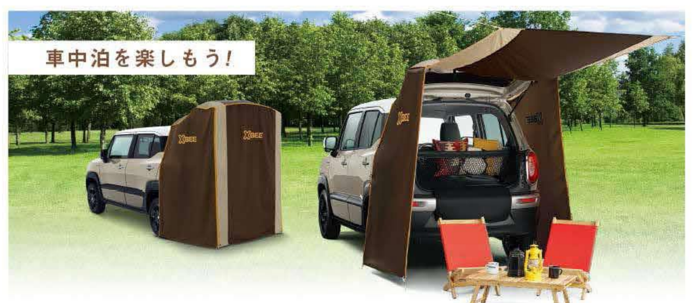
写真: HYBRID MZ アクセサリー装着車 ボディカラー: キャラバンアイボリーパールメタリック ホワイト2トーンルーフ (C7G)