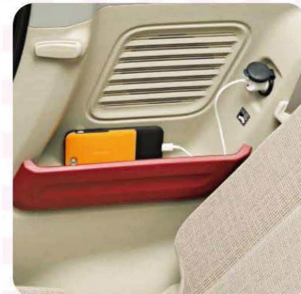
リヤクォーター ポケット + アクセサリー ソケット (HYBRID Gを除く)