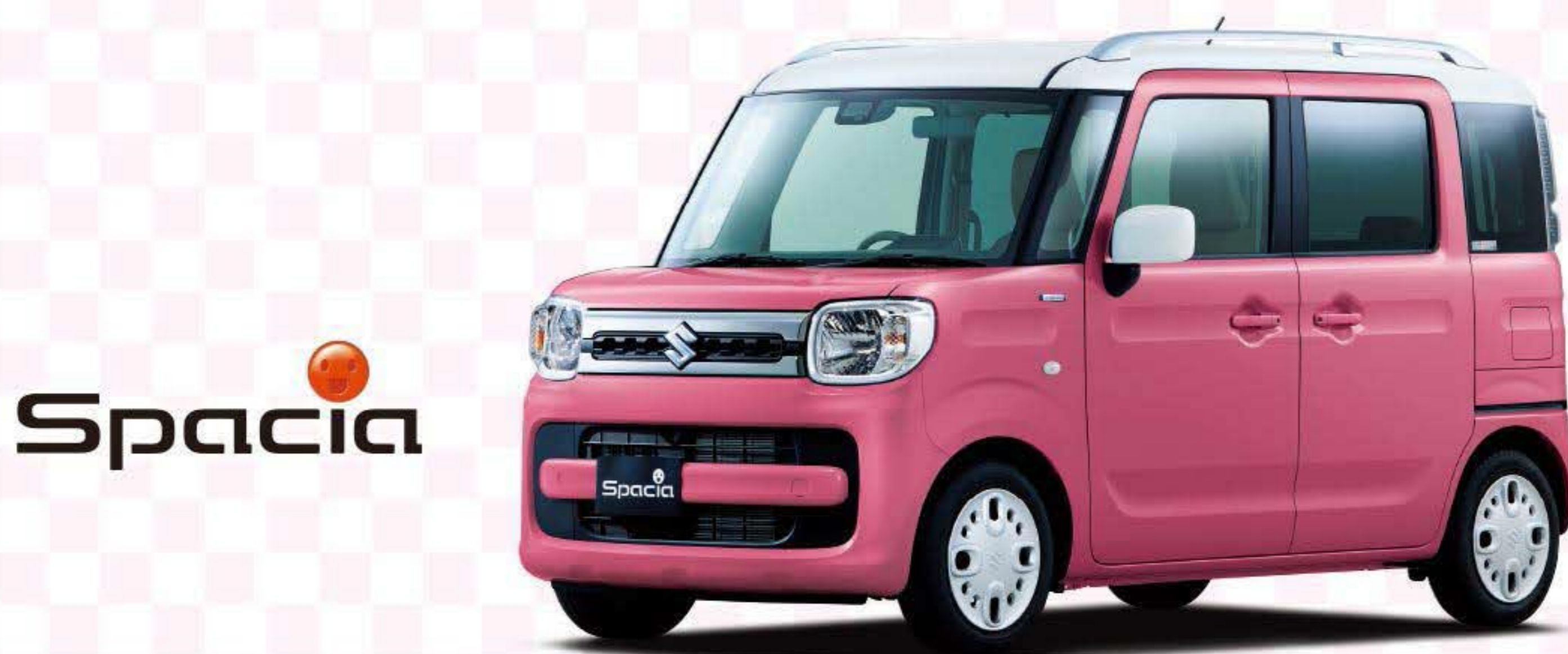
♡おしゃれ♡なスペーシア