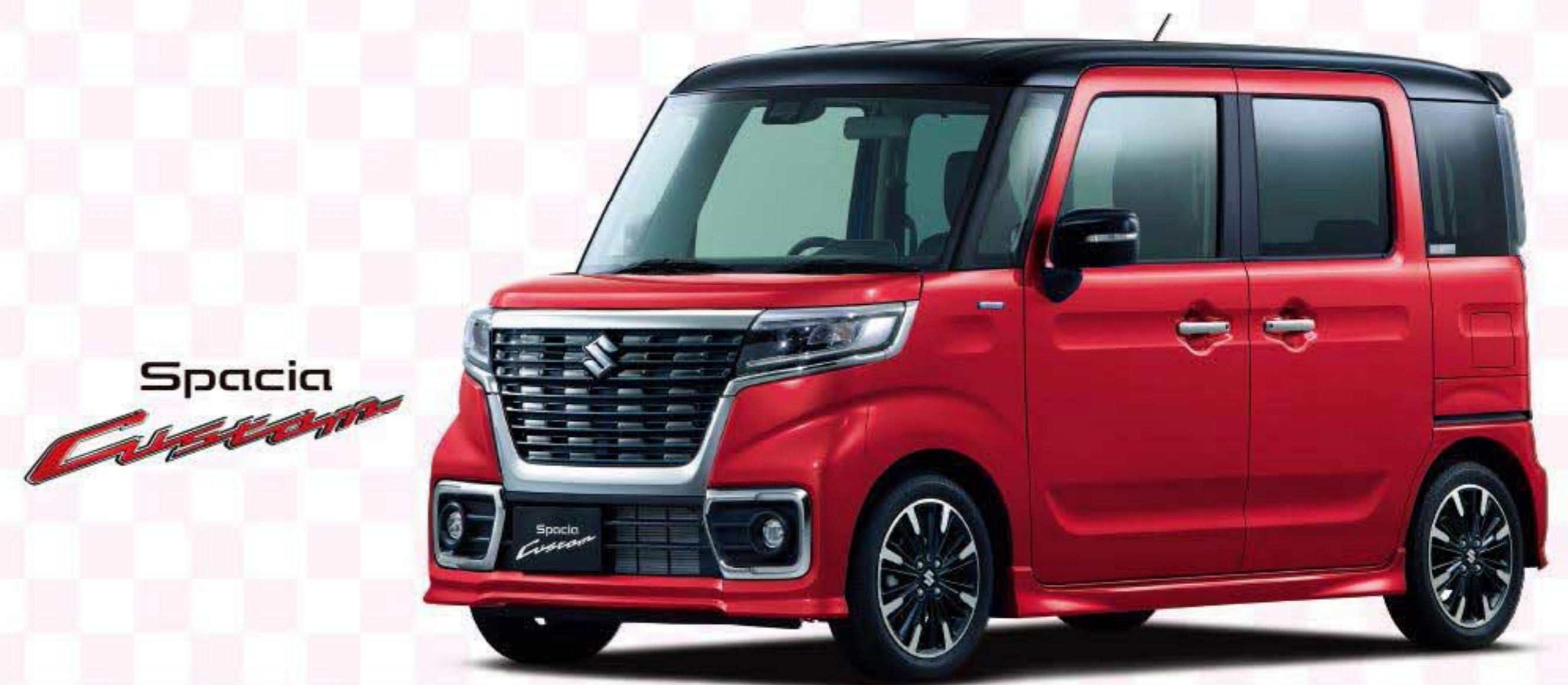
☆かわいい☆スペーシアカスタム