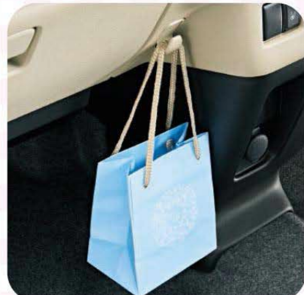
ショッピングフック