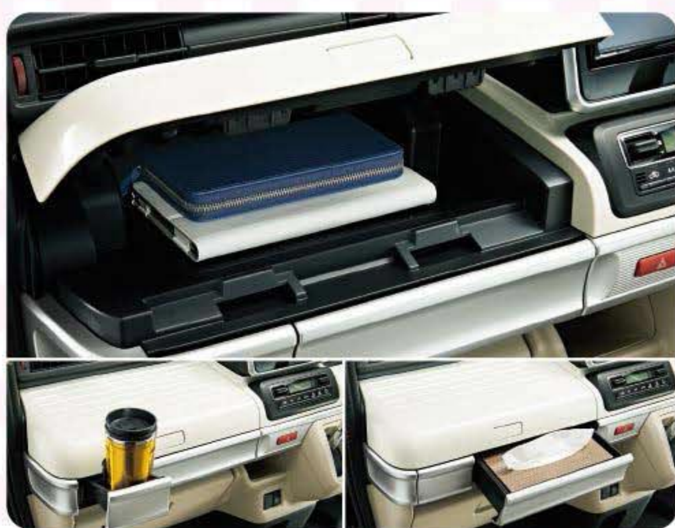
インパネアッパーボックス