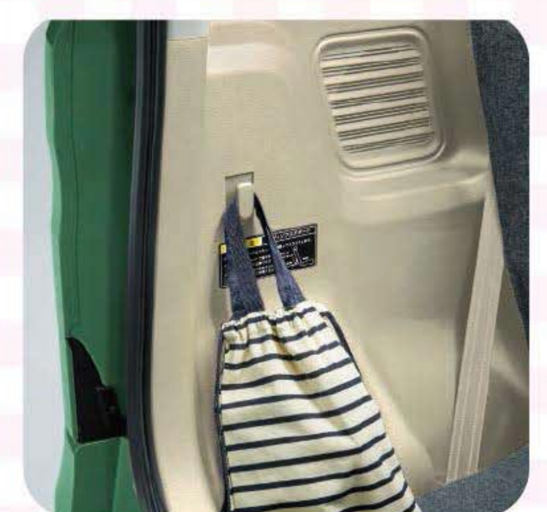
ショッピングフック (ラゲッジサイド左側)