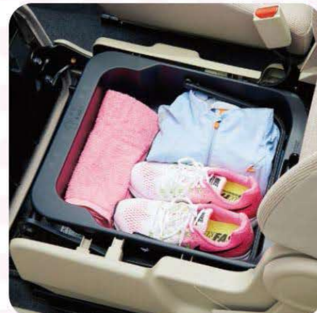
助手席シート アンダーボックス