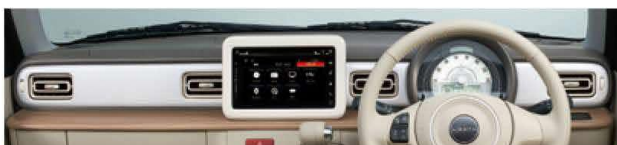
ホワイトカーボン調