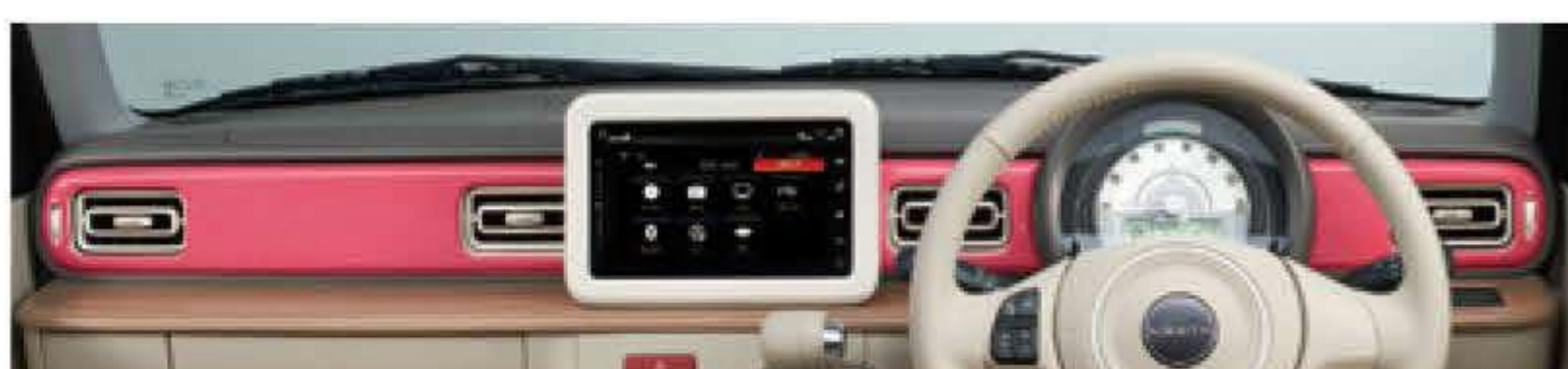
キャンディピンク