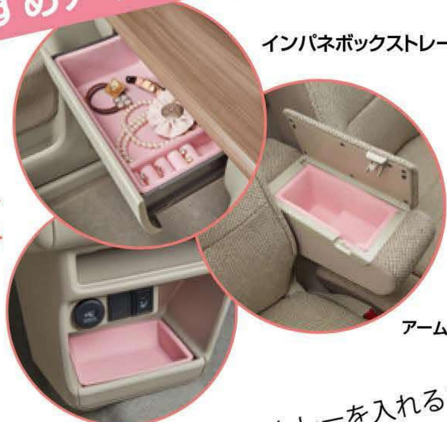
インパネボックストレー