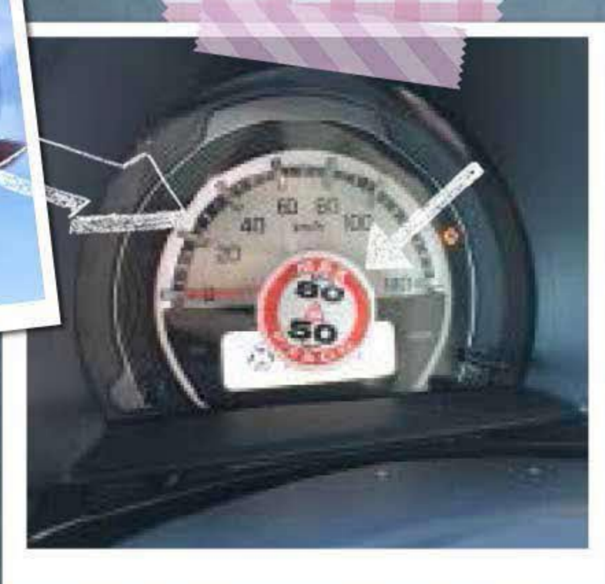
⑦ 車種ごとにエアの規定値が 違うので、運転席側の ステッカーでチェックしてください！