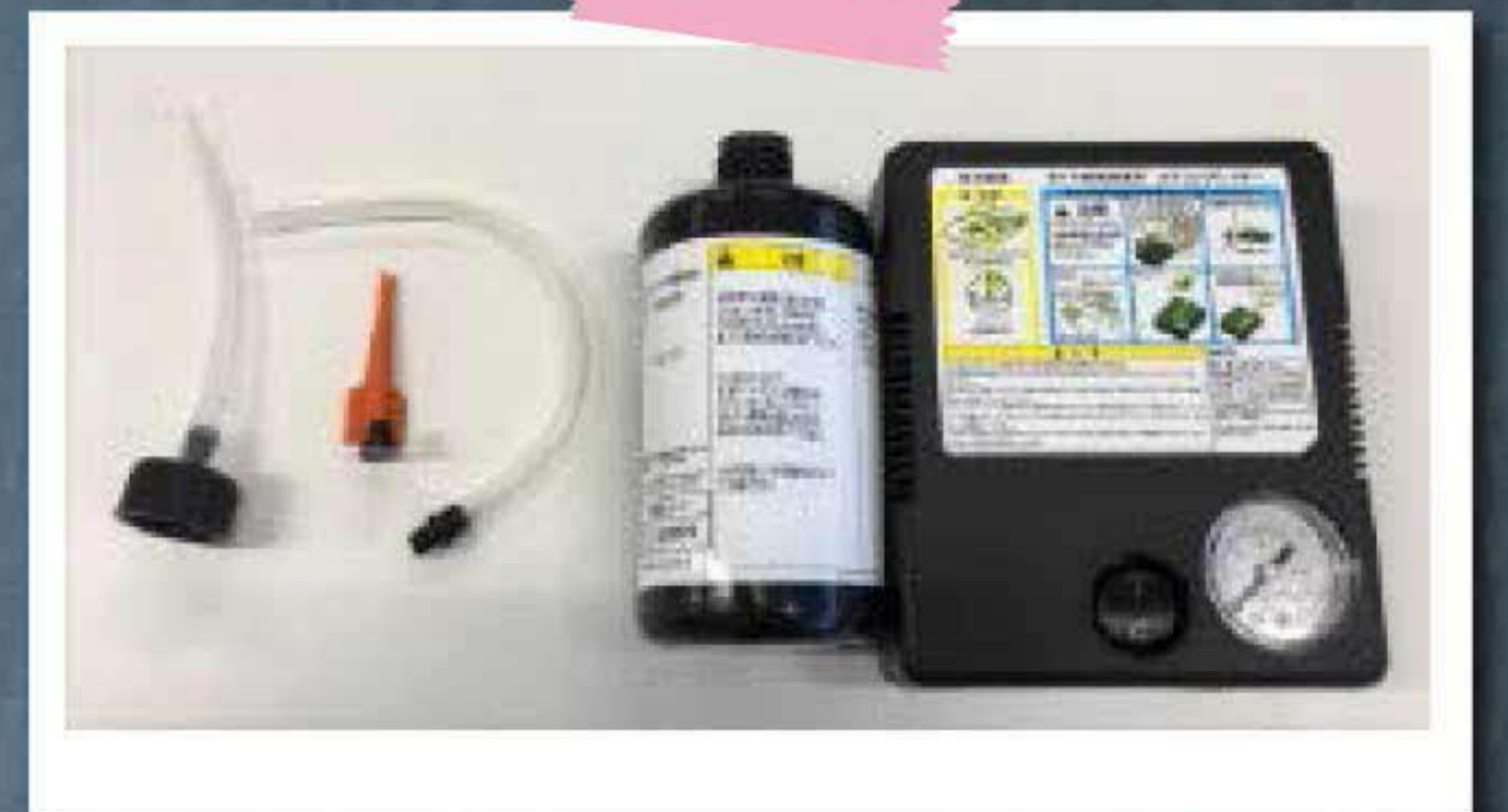
② キットの中身です。左から、 チューブ付きキャップ・虫抜き・ 修理剤・コンプレッサー

※釘等が刺さっていても決して抜いてはいけません！そのまま修理してください！ サイドが避けている場合は修理不可能なので迷わずJAFなど呼んでください！