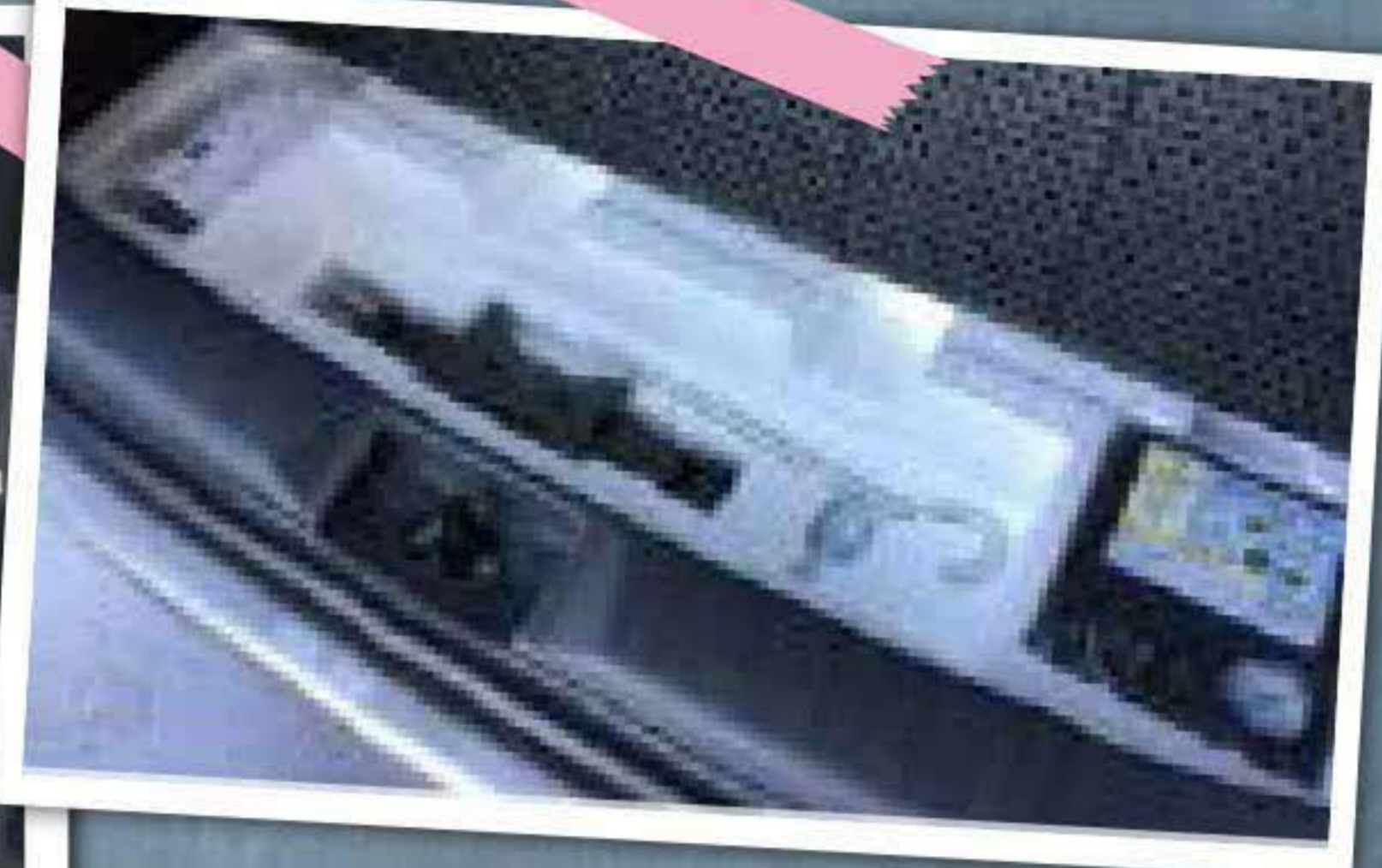
① バックドアを開けて、荷室の下に 修理キットが入っています